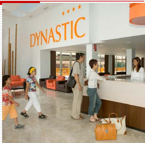
Úrval Útsýn sport - sundferðir