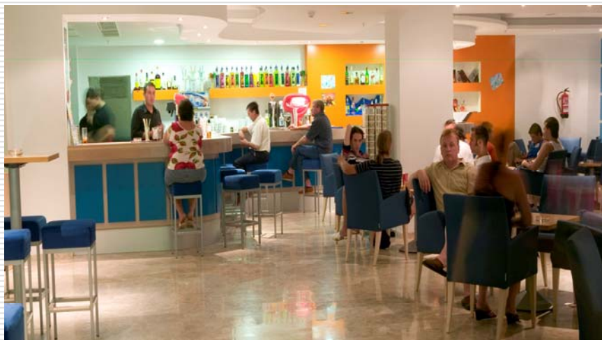
Úrval Útsýn sport - sundferðir