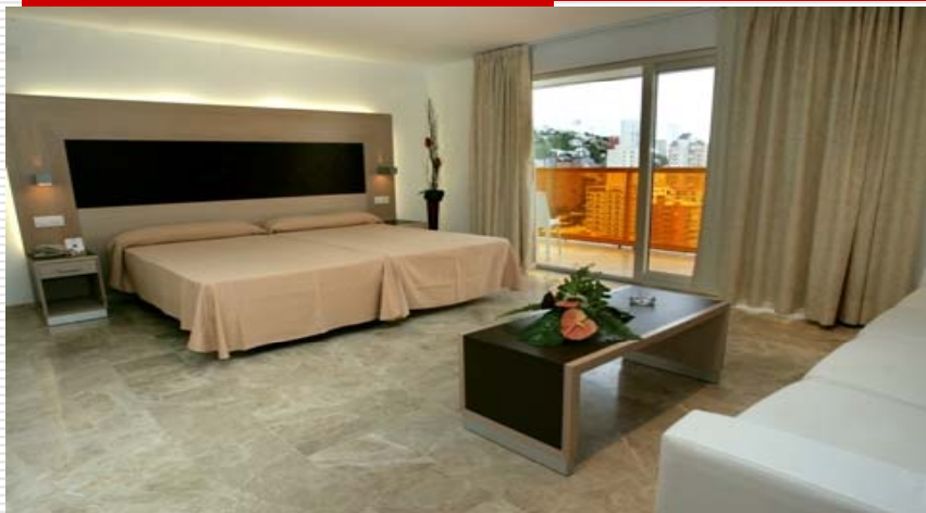
Úrval Útsýn sport - sundferðir