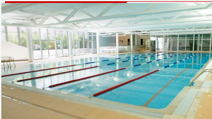
Úrval Útsýn sport - sundferðir