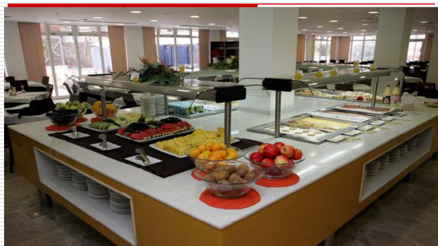
Úrval Útsýn sport - sundferðir