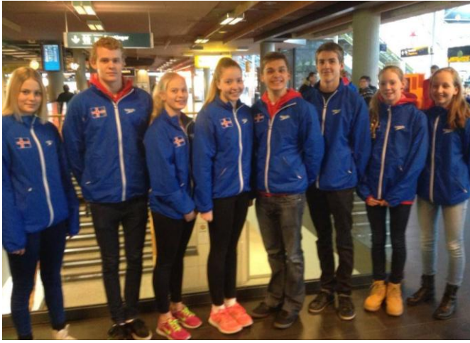
Jólastuð á Jólamóti ÍRB