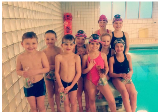
Flottir sundmenn ☺

Sundmenn í Flug- og Sprettfiskum í Njarðvík gerðu sér glaðan dag í lauginni þann 16. desember. Þá voru þau með dóta- og leikjadag. Í lok æfingunnar fengu síðan allir smá jólaglaðning.