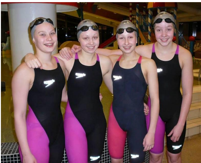
Íslandsmet slegin á Aðventumóti

Síðasta sundmót ársins hjá ÍRB var haldið um miðjan desember og er óhætt að segja að það hafi gengið glimrandi. Krakkarnir okkar héldu áfram að slá met eins og þau eru búin að vera svo iðin við síðustu mánuði og mörg Íslandsmet féllu sem voru áður hjá öðrum félögum.